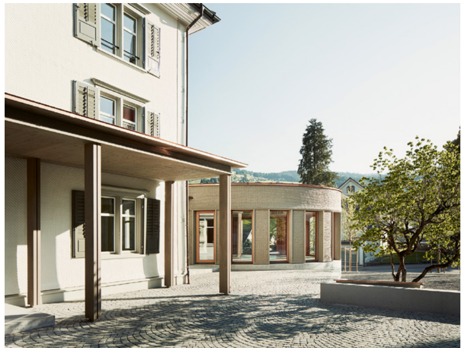
Bergende Form, geschindelte Fassade und verbindender Raum: Das neue Kirchgemeindezentrum